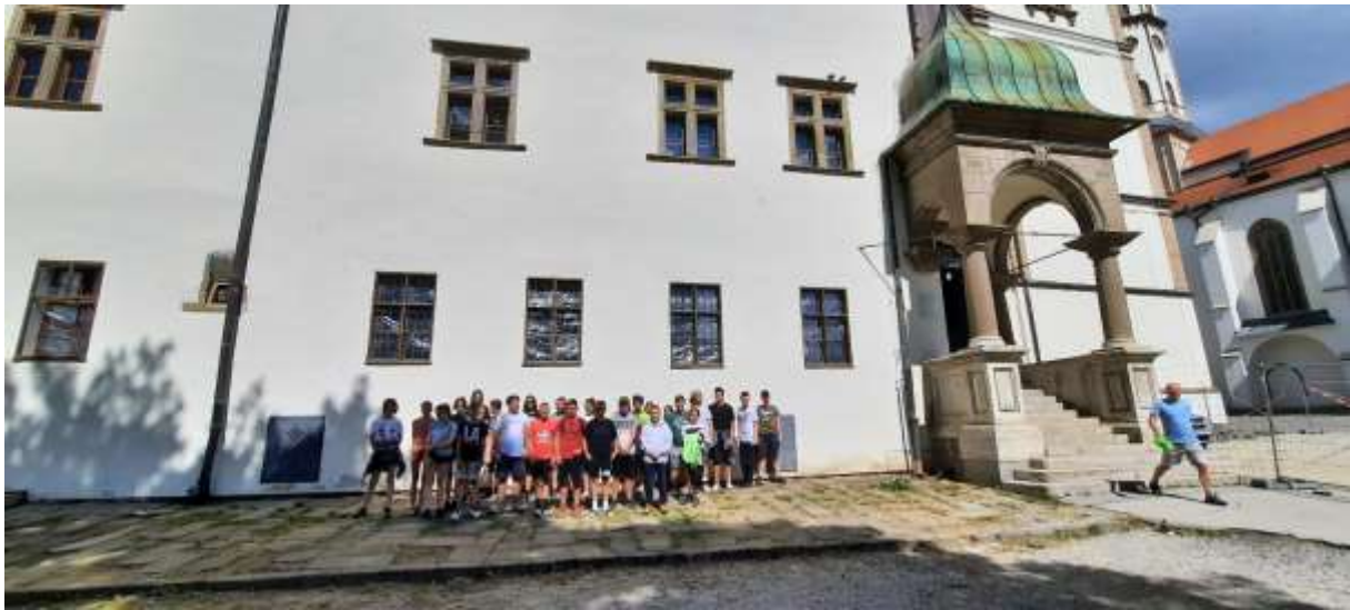
Szlovák paradicsom, bakancstúra